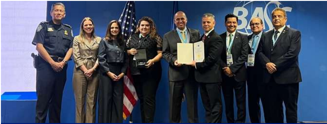
CAMPOSOL (empresa certificadas BASC por más de 22 años)