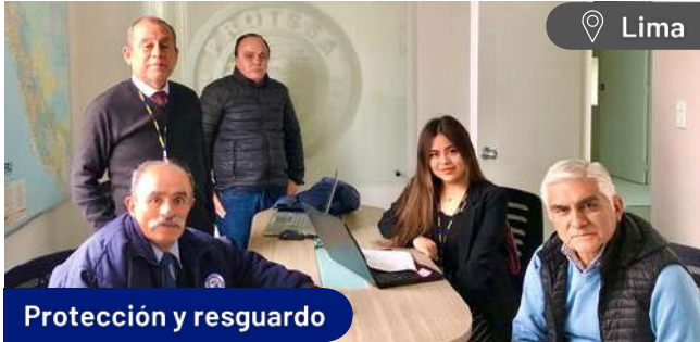
Protección y resguardo