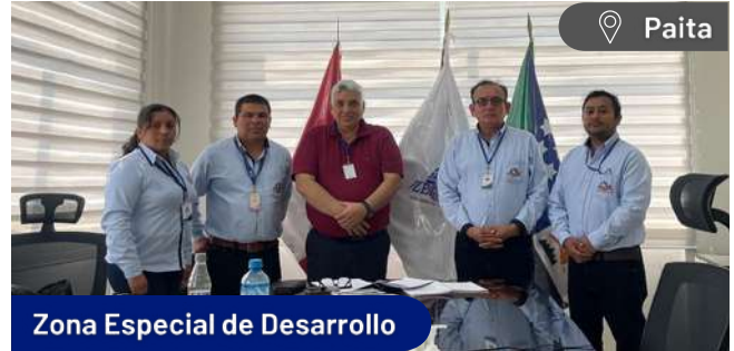
Zona Especial de Desarrollo