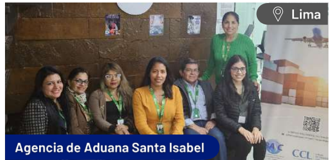
Agencia de Aduana Santa Isabel