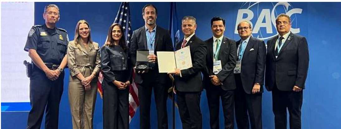
TRANSBER (empresa certificadas BASC por más de 21 años)