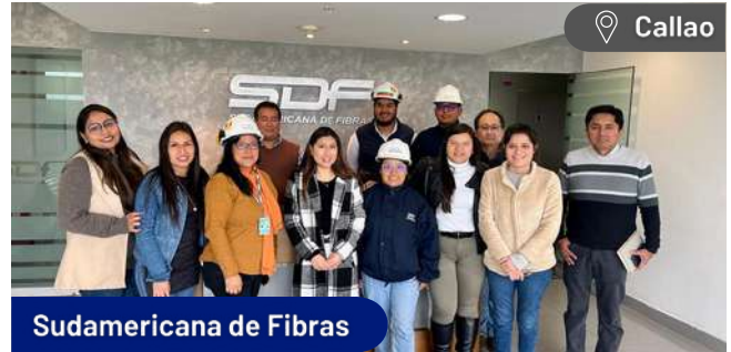
Sudamericana de Fibras