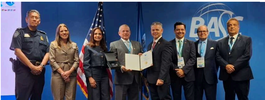
SHOHIN (empresa certificadas BASC por más de 21 años)