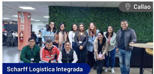
Scharff Logistica Integrada