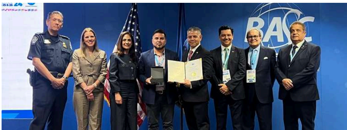
AGENCIA AFIANZADA DE ADUANA JKM (empresa certificadas BASC por más de 21 años)