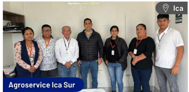
Agroservice Ica Sur