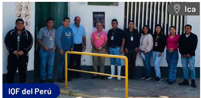
IQF del Perú