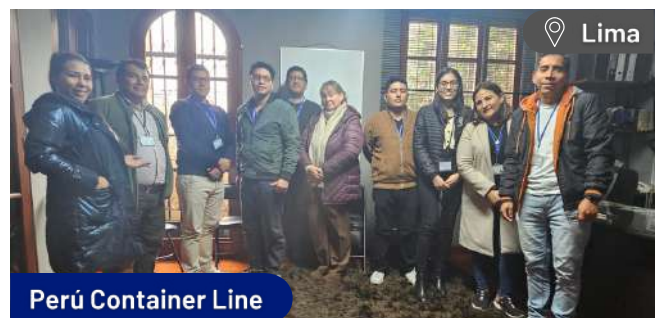
Perú Container Line