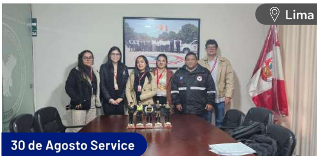
30 de Agosto Service