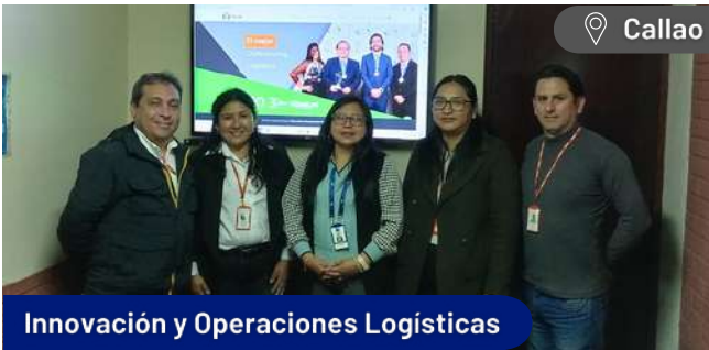
Innovación y Operaciones Logísticas