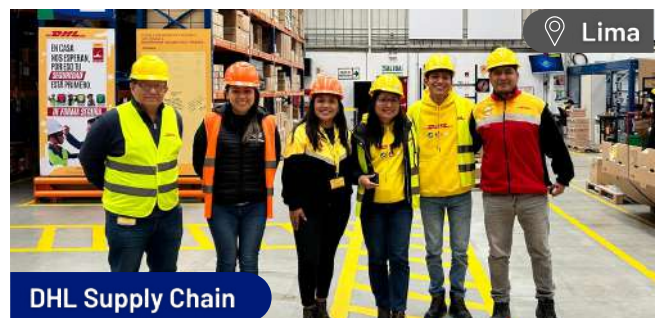
DHL Supply Chain