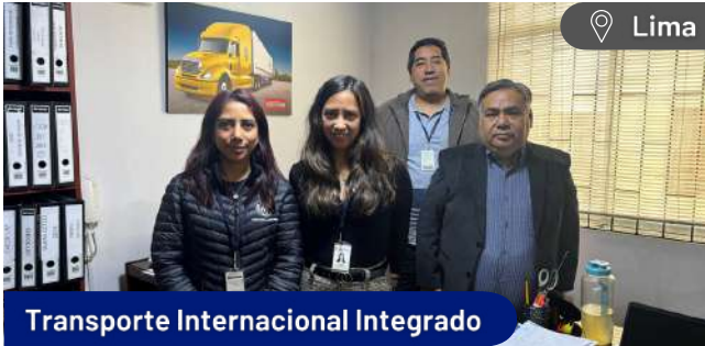
Transporte Internacional Integrado