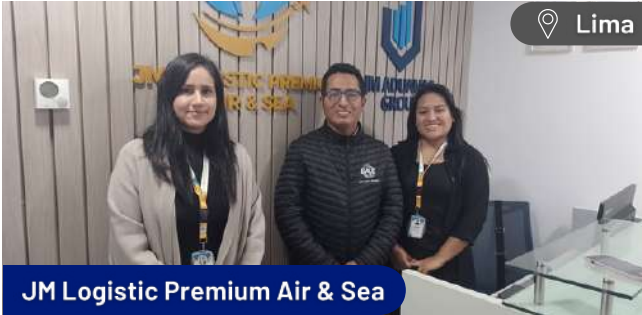
JM Logistic Premium Air & Sea