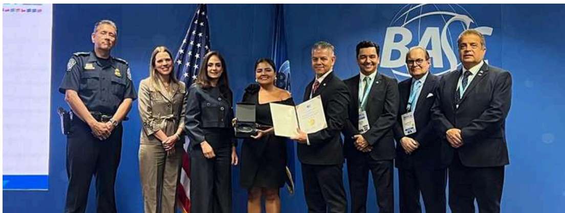
GAMARRA AIR CARGO (empresa certificadas BASC por más de 21 años)