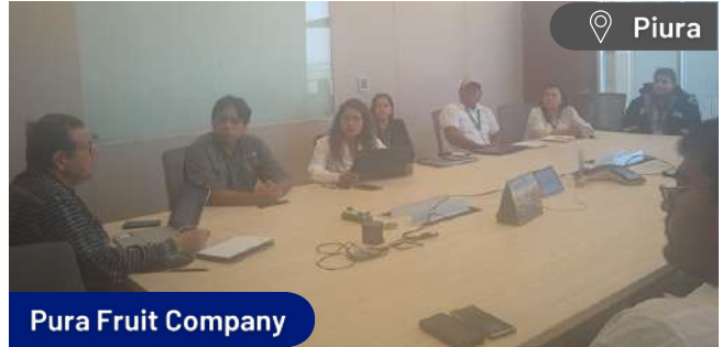
Pura Fruit Company