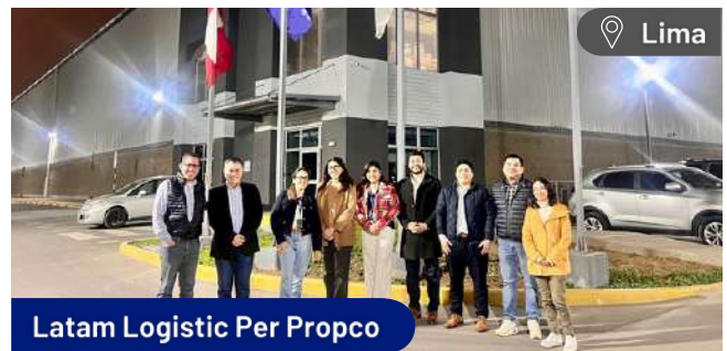
Latam Logistic Per Propco