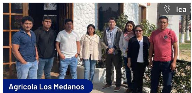
Agrícola Los Medanos