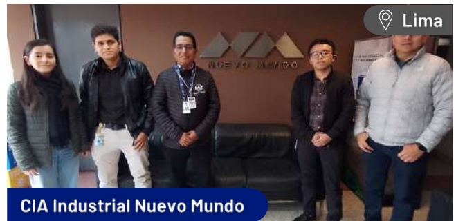
CIA Industrial Nuevo Mundo