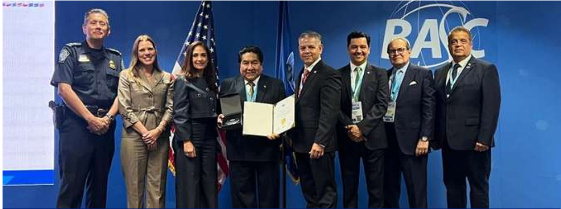
TALMA (empresa certificadas BASC por más de 22 años)