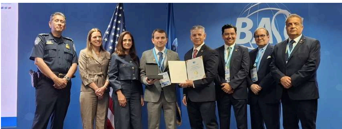
ACCIONA (empresa certificadas BASC por más de 21 años)